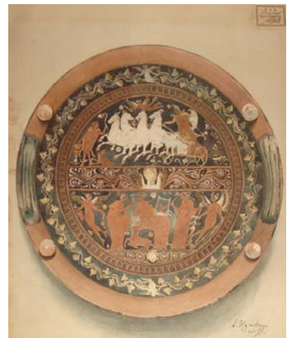
Краснофигурное блюдо. Архитектор А.В.Щусев, 1898 г., бумага акварель

Глазовка, Щусев в качестве образца выбрал Покровскую церковь в Кижях. Он поместил девятиглавое венчание на восьмерик, вырастающий из четверика, у юго-восточной части организовал придел и шатровую колокольню. Трапезную оформил галереями, Такая композиция создала выразительный силуэт сооружению.