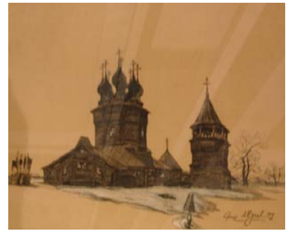
Проект церкви в имени Мансуровых — Глазовка. Архитектор А.В.Щусев, 1909 г.

При проектировании деревянной церкви на 750 человек в имени Мансуровых —