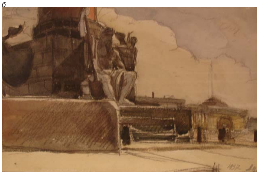
Акварели, А.В.Щусев: а — собор Св.Петра в Риме, этюд, 1939 г., бумага, карандаш, акварель; б — фрагмент ростральной колонны с видом на здание Адмиралтейства в Ленинграде, 1937 г., бумага, карандаш, акварель