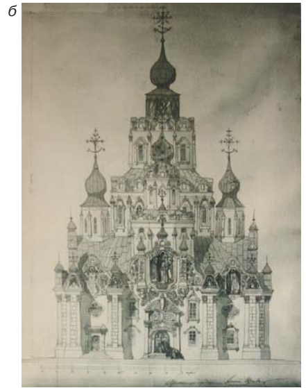
Михайловский Златоверхий монастырь в Киеве. Архитектор А.В.Щусев, 1908 г.: а — перспектива; б — церковь Великомученицы Варвары, западный фасад, эскизный проект