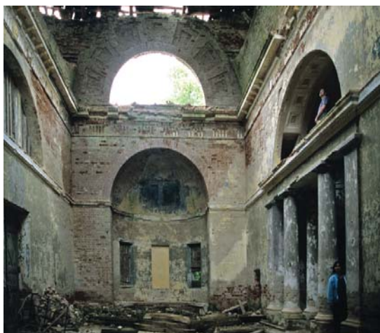
Интерьер верхней церкви. Вид на восток.

В интерьере храма в Горницах под колокольной находится отделенная двойной колоннадой экседра с ярусом хор. Мемориальная историческая аллюзия облика колокольни позволяет предположить, что эта загадочная южная апсида без окон предназначалась для надгробного памятника владельцам усадьбы, либо для размещения раки с мощами какого-то святого. В пользу первого предположения говорит наличие нижней церкви в цокольном этаже: как известно, также была расположена церковно-усыпальница самого Н.А.Львова в