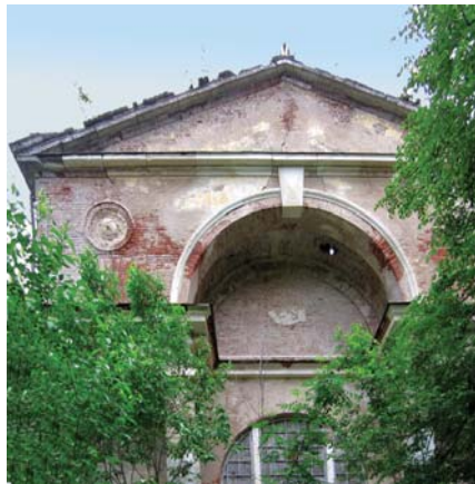
Аттик и фронтон северного портика. Фото. М. Верещака, 2007.

всего здания с древними источниками русской духовности в Киево-Печерской лавре). Тема христианской древности поддержана здесь низкой алтарной преградой, полностью вытесанной из белого камня. Иконы были вставлены в отдельные белокаменные ниши-киоты. Ещё четыре больших киота были устроены в углах церкви: по сторонам от входа и у иконостаса. Они выложены прямо в кирпичной