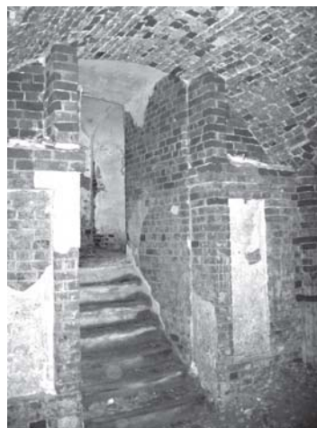
Вход в усыпальницу. Фото. М. Верещака, 2007.