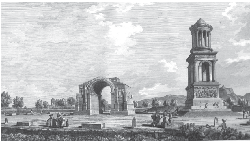
Гробница Юлиев и триумфальная арка Сен-Реми в Провансе. Гравюра из кн.: Voyage pittoresque de la France. Tome XII. Paris, 1800. Departement des Bouches-du-Rhône. Pl. 1.

сделанной по образцам башнеобразных памятников античности. По завершению в виде 12-колонного храма-ротонды, поставленного на призматическую башню с арками на все четыре стороны, вырастающую из рустованного основания, эта колокольня очень близка к гробнице Юлиев близ Сен-Реми в Провансе. В то время она справедливо считалась одним из лучших римских памятников и была в числе архитектурных достопримечательностей, часто посещаемых путешественниками.