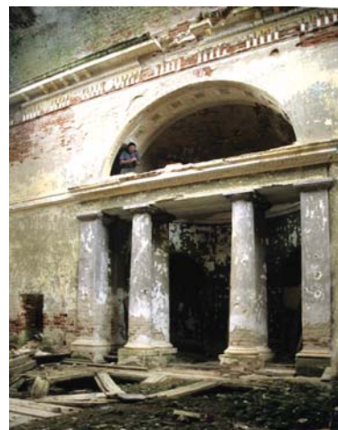
Владимирская церковь в Горницах. Колоннада южной экседры.

число ионических колонн ротонды — 12, а оба верхних яруса, напоминающие гробницу Юлиев, были вознесены над карнизом церкви, чтобы колокольня хорошо обозревалась с дороги при въезде в усадьбу.