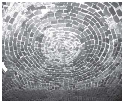
Центральная часть свода в нижней церкви. 2007.

кладке стены и увенчаны совершенно уникальными для львовских построек нарочито «готическими» (древнерусскими) бочкообразными стрельчатыми кокошниками. Прямо напротив лестницы, поднимающейся в усыпальницу, расположена большая ниша-келья (в пространственном отношении она оказывается под северной папертью-портиком). Её назначение неизвестно, но можно предположить, что здесь во время службы помещалась семья вла-