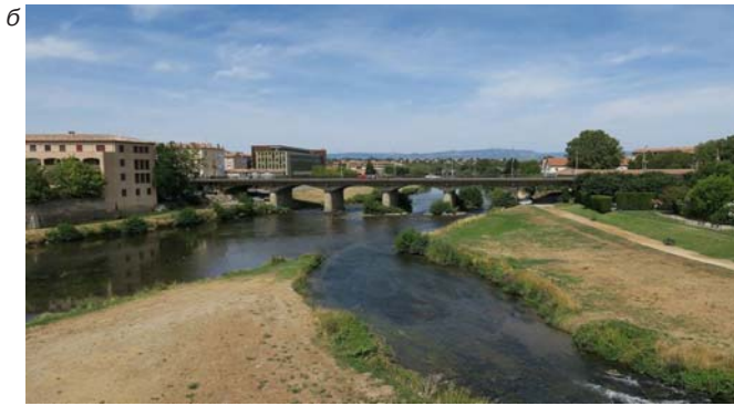
Старый мост через р. Од, XIV в. (а, б)