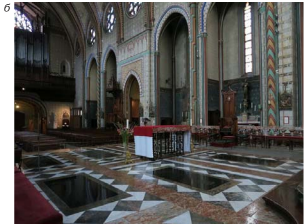
Собор Сен-Мишель (а, б)