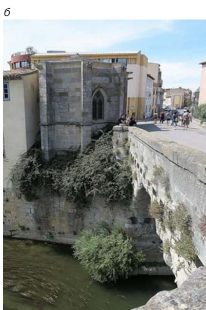
Часовня Нотр-Дам-де-Ла-Санте (а, б)

Мартимал Калвари квадратный в плане. Он имел вал и рядом сад Калвари. Вал засыпали и сделали бульвар.