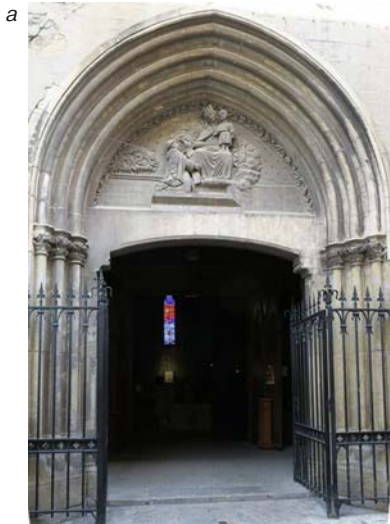
Часовня Кармелитов (а-в)