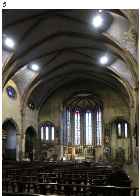
Церковь Сен-Венсен в Бастиде (а. б)

Защита замка была создана в XII в. семьей Тренкавель и постоянно укреплялась в последующее время. Ее конструкция была вынесена в виде стены и создан барбакан. Внешняя стена включала часть галло-романского рва III-IV вв. характеризующаяся маленькими отверстиями в кирпиче.