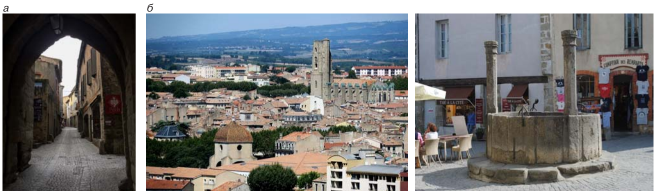
Верхний город (а, б)