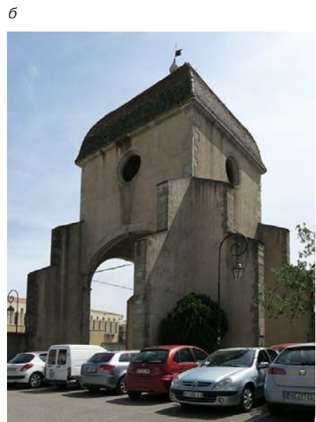
Улицы Нижнего города — Бастиды: а — старый рынок; б — отель Дье (госпиталь) XVIII в.

логические раскопки не подтвердили этого.