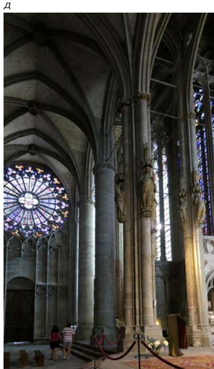
Базилика Сен-Назар (а-д)

квадратные башни и двойные стены присутствуют в крепости Голубац XIV в. в Сербии на берегу Дуная.