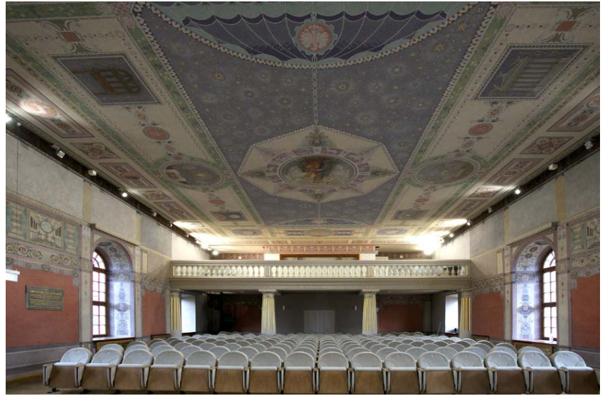
Лицей Малаховянка (консервация настенной живописи в главном зале). Плоцк, 2014 г.

задействована большая группа польских реставраторов из варшавской Академии изящных искусств. В ходе работ использовались новейшие реставрационные технологии. Проведенные исследования пролили свет на многие тайны первого этапа строительства дворца для короля Яна III Собеского. После реставрации Дворец стал одной из наиболее презентабельных достопримечательностей рубежа XVII-XVIII вв.