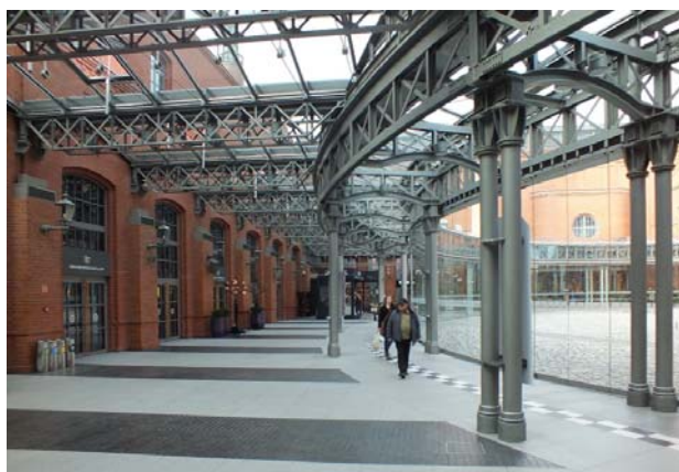
Старый бровар, (промышленное сооружение 1850 г.) Познань, 2002-2005 гг. Архитектурная студия АДС