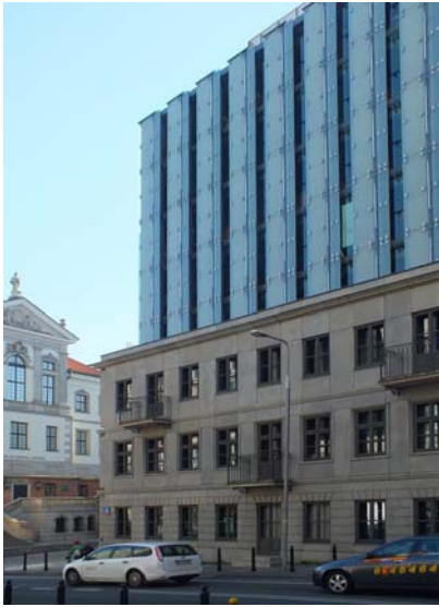
Шопинг центр. Варшава, 2005 г. Архитектор Б.Стельмах