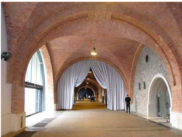
Королевский дворец. Аркады Кубицкого. Варшава, 2006 г. Архитектурная студия СТ.Фишер

Созданные в XIX в. Аркады Кубицкого служили в качестве