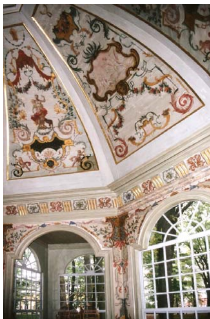
Вольеры, (консервация настенной живописи 1722 г). Петергоф, 2006 г. Архитекторы У.Домбровска, П.Горек

Проект приспособления бывшей трамвайной электростанции под Музей варшавского восстания заслуживает внимания из-за богатства исторической тематики и широкого освещения проблематики восстания в контексте политической обусловленности национально-освободительной борьбы поляков. Тем не менее, этот смелый проект с архитектурной точки зрения был осуществлен не самым лучшим образом. Хотя сохранен характер исторических фасадов зданий и даже осуществлена реставрация части оригинальных установок и технического оборудования бывшей электростанции. Но посещающий ее турист не получает четкого представления об истории самой достопри-