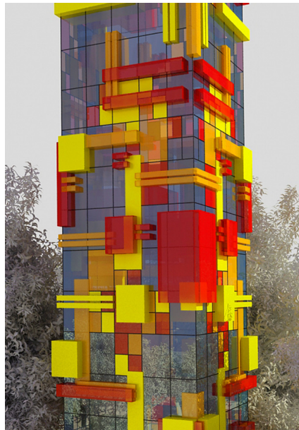
Проект делового центра в Новосибирске. Архитектор П.В.Сапов

Судите сами, одна из компаний-застройщиков в Москве, сняла серию рекламных роликов, которыми нас «мучали» каждый день. Художественный образ весьма незамысловат — на красном фоне белые буквы, выполненные весьма простеньким шрифтом, без утонченности и изысков, что не соответствует гордому званию «минимализм», и примитивная двухцветная анимация. Хуже визуального ряда могут быть лишь рифмы, претендующие в этой рекламе на стихотворения: «квартира нужна, чтобы она не ушла», «как не крутись, без своей квартиры не обойтись» и т.п.. И это в стране, где жили Пушкин, Есенин, Маяковский! Сказать, что на рекламе сэкономили — ничего не сказать. Ощущение, что сей «бессмертный шедевр» был создан на планшете минуты за 4 во время перегона между станциями Коломенская и Технопарк. Бюджет,