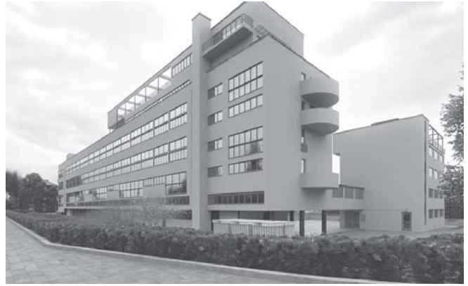
«Дом-коммуна». Общежитие №1 Текстильного института Дом Наркомфина

водоснабжением и ванными, но и столовую-ресторан, амбулаторию, продуктовый спецраспределитель, необходимый в условиях карточной системы, прачечную. Кроме того, планировалось построить дополнительный корпус дома-коммуны на 200 квартир, где должны были разместиться столовая, клубный зал, читальня, детский сектор, амбулатория, стационар, аптека, кооператив, гараж и другие помещения.