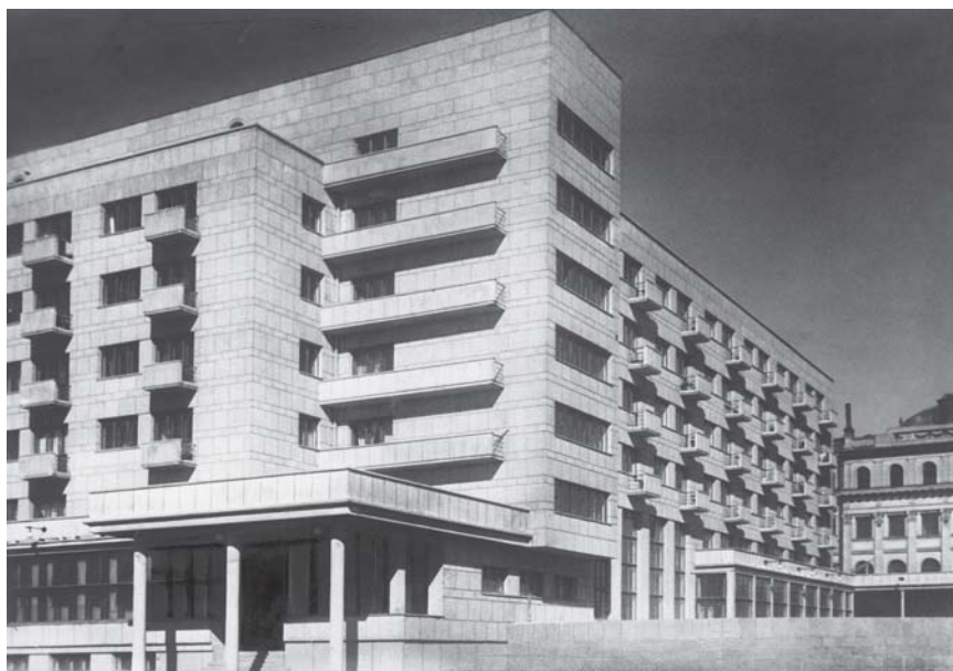
Дом-коммуна Общества политкаторжан, 1933 г., Санкт-Петербург

Несколько позже, в 1929-1933 гг, в Ленинграде на Петроградской стороне началось строительство дома-коммуны Общества политкаторжан и ссылопоселенцев по проекту архитекторов Г.Симонова, П.Абросимова, А.Хрякова. Построенный в стиле конструктивизма более комфортный дом для элитных жильцов из расчёта один человек на комнату включал в себя не только жилые помещения (145 квартир по 2-5 комнат) с горячим