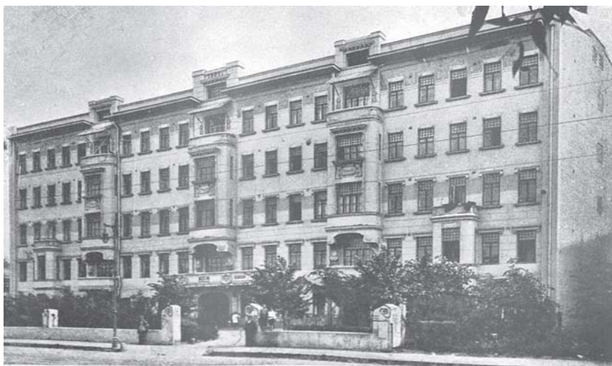
Первый дом-коммуна на Большой Садовой, д. 10. в Москве

Совершенно особое место в этом ряду занимает экспериментальный Хавско-Шаболовский квартал бригады АСНОВА. Мы редко сейчас вспоминаем, что архитектура авангарда не существовала как единая эстетическая программа: это были враждующие группировки с совершенно разными концепциями и идеологией. Конструктивисты (ОСА) больше строили, тогда как рационалисты (АСНОВА) — разрабатывали теорию и преподавали. Именно поэтому единственный реализованный рационалистами в Москве проект особенно интересен. Поставленные под углом 45 градусов к существующей сетке улиц квартал