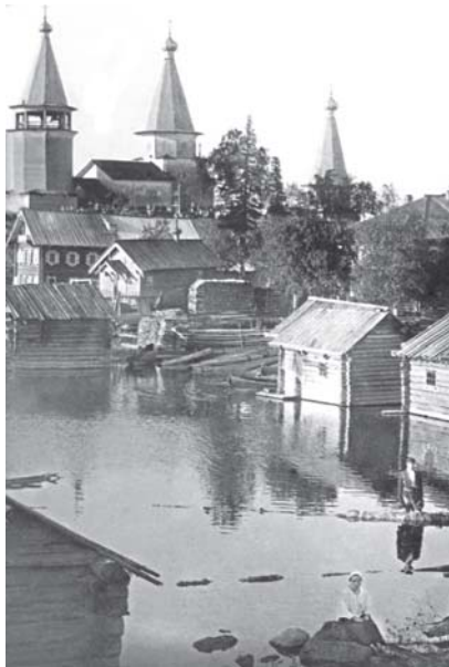
Рис.4. Погост. Общий вид с юго-запада, со стороны Космозера, 1926 г.

положение церквей увязано с выявлением природных доминант: устье реки, наиболее высокие или «напряженные» точки рельефа, совпадающие с границами перепада рельефа. Так, церковь Успения Богоматери (1620 г.) в Космозерском погосте* расположена на высокой точке рельефа [4] (рис.4). Храмы являлись показателем высокого иерархического статуса поселения, а значит его стабильности.