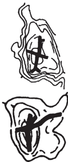
Рис.2. Сельские поселения (деревни Алексеево и Железово, Псковская область) с рельефом (Бежаницкая возвышенность)