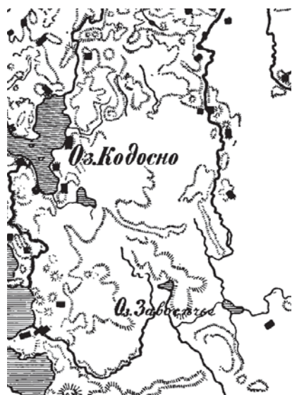
Рис.1. Влияние архитектоники ландшафта на сельское расселение (западная часть Торопецкого уезда Псковской губернии, начало XX в.)

Природно-климатические условия, выраженные в архитектонике материнского ландшафта, обуславливали выбор местоположения селений, площадок для них, их планировку. Так, мелкие деревни в Псковском уезде были разбросаны почти исключительно в области сильного развития моренного ландшафта, на выпуклых расходящихся склонах [2] (рис.1), где