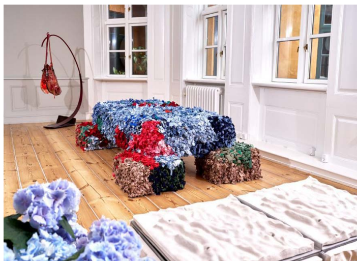
Рис.2. Студия Tableau. Текстильная скульптура. Дизайнер Р.Лайбошиц