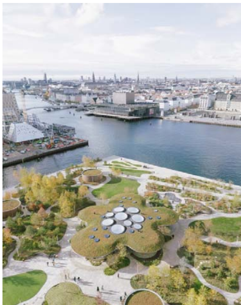
Рис. 12. Opera Park в гавани Копенгагена. Площадка фестиваля для проведения мастер-классов и бесед