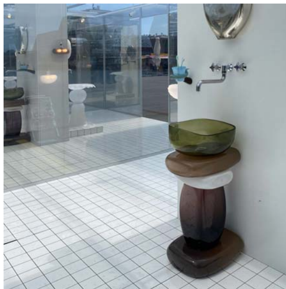
Рис. 9. Стекланная ванна. Студия Heven