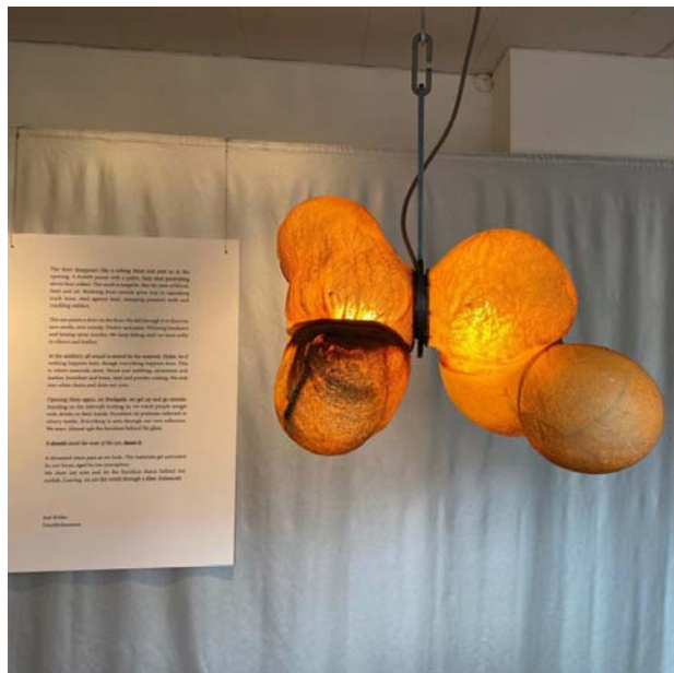
Рис. 13. Светильник в виде овечьего желудка. Экспозиция Келлемо. Дизайнер М.Бюссьен

На фестивале были показаны их предметы: скамья Saku от Р.Фенханна (Rasmus Fenhann), голубая мебель, изготовленная Л.Ремом (Lerke Ruom) из поношенных джинсов, текстиль с трафаретной печатью Тронхьема Ремера и кубики бесконечности А.Свендсена (Alberte Svendsen), покрытые крашеной соломой.[8]