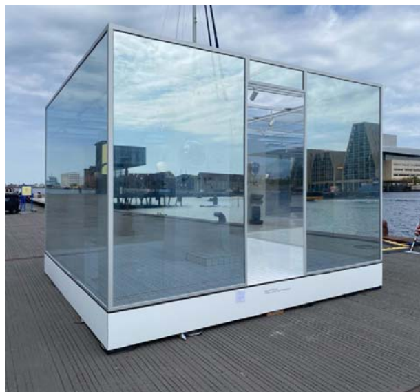
Рис. 8. Стекланный куб

Датские дизайн-студии и дизайнеры работают по-разному, но каждый по-своему хотят переосмыслить, что предлагают зарубежные школы дизайна. Таким образом, фести-