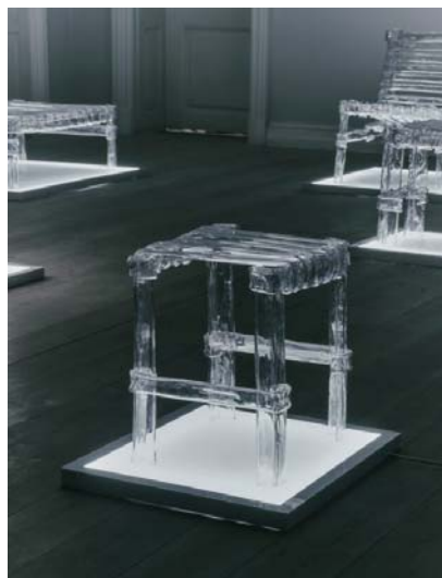
Рис.1. Коллекция Crafting Plastics. Пластиковый табурет. Дизайнер К.Кистер

Студия Tableau открыла постоянный шоу-рум в Копенгагене, в котором продемонстрировала предметы