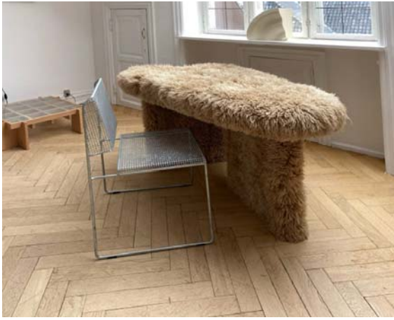
Рис.10.Письменный стол. Студии Kasa Kasa. Металлический стул. Студия Carlberg Design