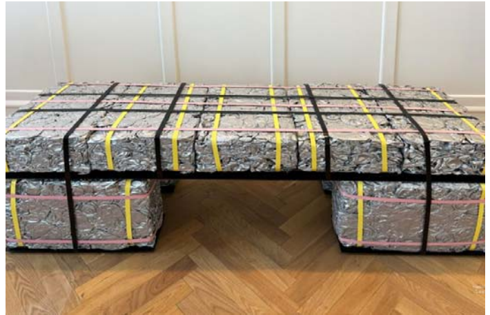
Рис.11.Скамейка из измельченных консервных банок. Студия Agnes Studio

тиваль в Копенгагене позиционируется как лаборатория и исследовательский центр дизайна.