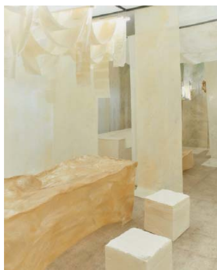
Рис.3, 4. Студия Tableau. Кресло и полка. Дизайнеры Дж.Эгеберг, Л.Галли