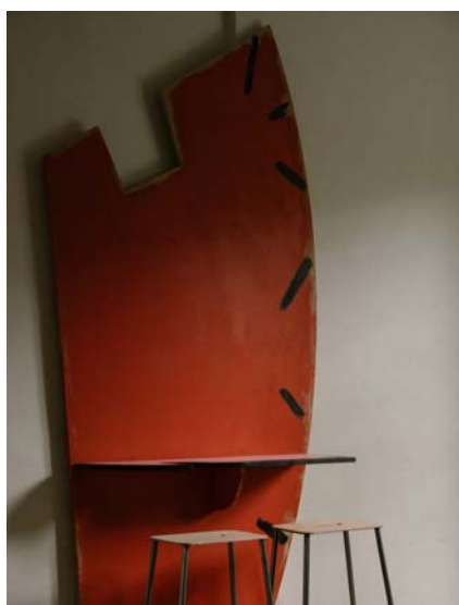
Рис.6. Скульптурная мебель. Дизайнер Ф.Тугуд

Дизайнеры изучают основные принципы, которые мотивируют людей, все, что описывает их характер и работу. Если обязанности сотрудников подразумевают неформальный подход, для них как нельзя кстати подойдет